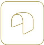
Cintrage à chaud