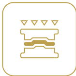
Formage à chaud