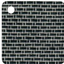
NOIR Réf : BL008