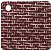
ROUGE Réf : BL004