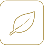
Matières d'origine végétale