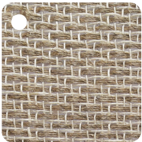
NATUREL Réf : BL000

Le matériau Varian® offre aussi une possibilité de personnalisation des couleurs. Six coloris standards existent mais il y a aussi la possibilité de choisir une couleur sur-mesure.