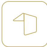
Pliage au fil chaud

Le matériau Varian® offre aussi une possibilité de personnalisation des couleurs. Six coloris standards existent mais il y a aussi la possibilité de choisir une couleur sur-mesure.