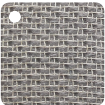
ENCENS Réf : BL003