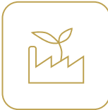
Imprégnation sans eau ni solvant