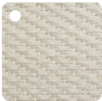
NACRÉ Réf : BL001