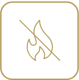
Réaction au feu M1/M2

Le Varian® est destiné à être utilisé dans l'ameublement, l'aménagement intérieur et les transports. Il est donc formulé pour correspondre aux normes feu et UV des marchés en question.