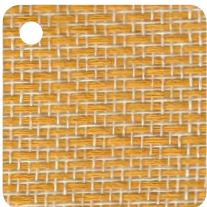
JAUNE Réf : BL007