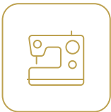
Finitions et assemblage